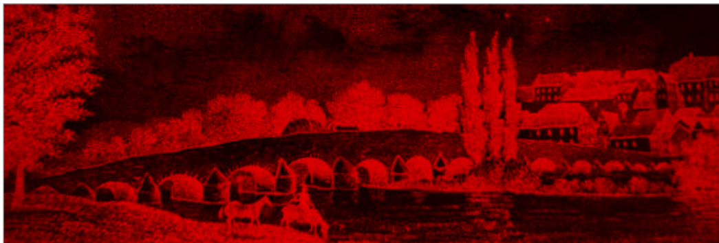
Abb. 38. Die 16-bogige Saalebrücke