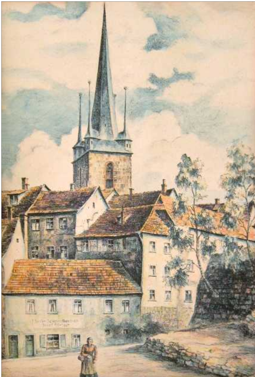
Blick vom heutigen Johann-Walter-Platz auf die Jenaische Straße und die „Burg“. Pastell von Fritz Tischendorf