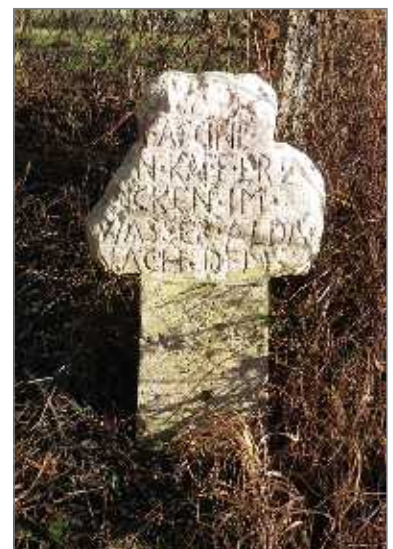
Abb. 40. Steinkreuz bei Ölknitz