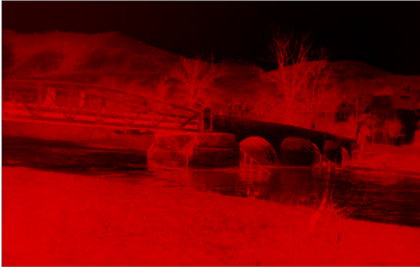
Abb. 39. Saalebrücke mit eisernem Mittelteil aus Lauchhammer von 1877