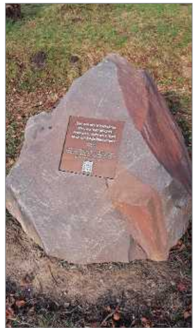
Abb. 37. Gedenkstein zur Bücherverbren- nung von 1933

Vom Gries aus werfen wir einen Blick auf die für Kahla wichtige Saalebrücke. Auch ihre Geschichte können wir nur kurz streifen. 1365 wird sie, damals eine teilweise überdachte Holzbrücke, zum ersten Mal erwähnt. 1563 ist sie bereits weitgehend aus Stein und ruht, über die Lache reichend (hier wohl noch aus Holz), auf 17 Bogen. Dies geht aus